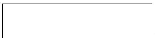
Схема границы эксплуатационной ответственности

(указать адрес, наименование объектов и оборудования, по которым определяется граница балансовой принадлежности организации водопроводно-канализационного хозяйства и заказчика)